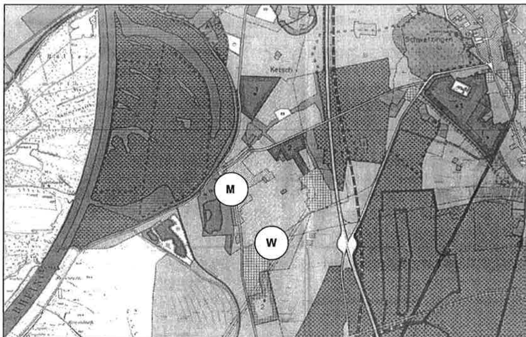
Abb. 1: Ausschnitt aus dem Flächennutzungsplan 1982/1983 des Nachbarschaftsverbandes Heidelberg-Mannheim Im aktuellen Flächennutzungsplan der Gemeinde Ketsch aus dem Jahr 1982 4 , der die Nutzung der Gemeindefläche in ihren Grundzügen darstellt, ist das Untersuchungsgebiet des städtebaulichen Rahmenplans (zur näheren Erläuterung siehe Kapitel 3.1) vorwiegend als Wohnbaufläche und in einem nordwestlichen Teilbereich, bei dem es sich um den Altortbereich und sein näheres Umfeld handelt, als Mischbaufläche dargestellt.