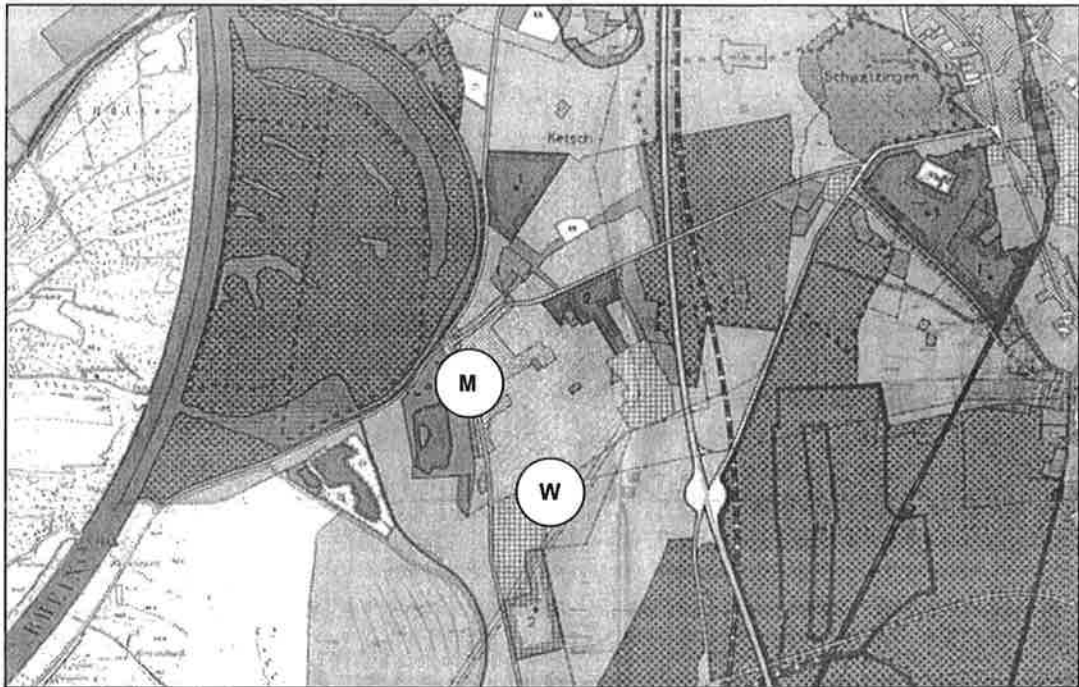
Abb. 1: Ausschnitt aus dem Flächennutzungsplan 1982/1983 des Nachbarschaftsverbandes Heidelberg-Mannheim

Im aktuellen Flächennutzungsplan der Gemeinde Ketsch aus dem Jahr 1982 4 , der die Nutzung der Gemeindefläche in ihren Grundzügen darstellt, ist das Untersuchungsgebiet des städtebaulichen Rahmenplans (zur näheren Erläuterung siehe Kapitel 3.1) vorwiegend als Wohnbaufläche und in einem nordwestlichen Teilbereich, bei dem es sich um den Altortbereich und sein näheres Umfeld handelt, als Mischbaufläche dargestellt.