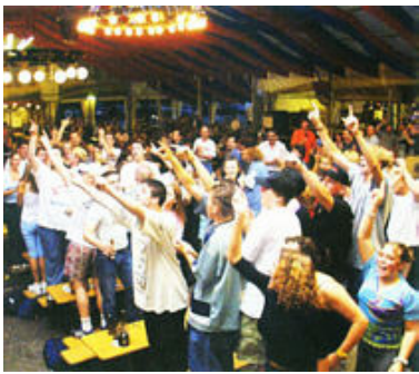
Ketscher Backfischfest, ein Erlebnis für jung und alt

Das Ketscher Backfischfest erfreut sich seit über 50 Jahren großer Beliebtheit bei jung und alt.