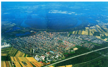
Luftbild von Ketsch im Jahr 2002

Württemberg) an Bedeutung gewonnen. Nach Beendigung der Befreiungskriege drängten die Menschen auf Beseitigung des Untertanenjoches sowie der staatsbürgerlichen Anerkennung und politischen Mitbestimmung. Zwar war die badische Verfassung von 1818 in bürgerlicher – liberaler Hinsicht für jene Zeit vorbildlich, aber dennoch kam es in Baden zu Volksaufständen. Der Putschversuch im April 1848 unter Friedrich Hecker und Gustav Struve wurde ebenso niedergeschlagen, wie ein Jahr später der Aufstand in Baden und der Pfalz.