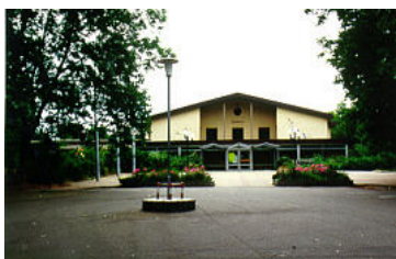
Rheinhalle – Haupteingang

Diese Mehrzweckhalle mit einer Kapazität von nahezu 2000 Sitzplätzen entstand bereits im Jahr 1959 auf einem ehemals sumpfigen Gelände im Ketscher Bruch. Die Rheinhalle mit einer stützungsfreien Fläche von 28 m x 45 m wurde schnell zum Mittelpunkt des örtlichen, sportlichen und kulturellen Lebens und bildete einen Anziehungspunkt für viele überörtliche Veranstaltungen. Die Entscheidung zum Bau einer solchen groß dimensionierten Halle ist bis zum heutigen Tag richtungsweisend gewesen. In den Jahren 1986 und 1987 erfolgte eine grundlegende Renovierung und Modernisierung der Rheinhalle. Nach dieser umfassenden Umgestaltung muss die Rheinhalle