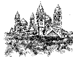
Kaiserdom zu Speyer

In einer Urkunde aus dem Jahr 1156 war von einem „Terra in Kets“ die Rede. Es handelte sich dabei um ein Hofgut oder einen Meierhof, der sich im Eigentum des Klosters Maulbronn befand.