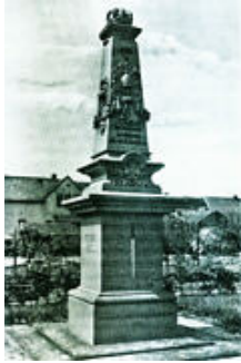
Kriegerdenkmal für die Gefallenen 1870/71

Opfer unter den Kriegsteilnehmern gefordert, war aber im Vergleich zu den darauffolgenden Kriegen relativ glimpflich an der Bevölkerung vorbei gegangen. Die beiden Weltkriege