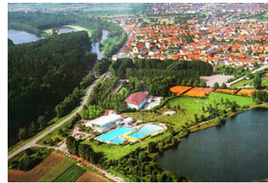
Luftbild der Gemeinde Ketsch mit dem angrenzenden Naturschutzgebiet "Ketscher Rheininsel"

Rheininsel in ihrem ganzen Ufer unter Naturschutz gestellt hat.