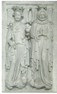
König Ruprecht mit Gemahlin (Grabmal in der Heiliggeistkirche zu Heidelberg)

Von der großen Politik blieben die Bewohner in dem Fronhof „Kaz“ jedoch zumeist unberührt. Sie litten vielmehr unter den „normalen Gegebenheiten“ jener Zeit, wie Krankheiten, Seuchen, Überschwemmungen und Kriegen, die sie immer wieder heimsuchten und ihr Leben oftmals zur Plage werden ließ.