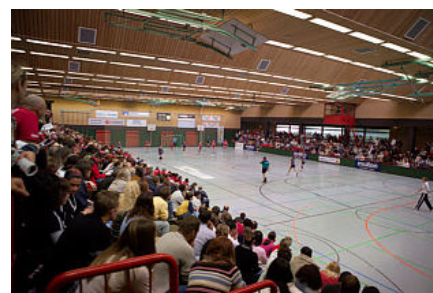
Neurothalle Ketsch, Austragungsort vieler großer Sportereignisse

Nach mehrjährigen Planungs- und Umgestaltungsarbeiten wurde am 22.06.1990 die neue Ortsmitte Ketsch ihrer Bestimmung übergeben. Dieser neue Ortsmittelpunkt stellt mit seinen großzügig schön gestalteten Grün- und Freiräumen, den Ladengeschäften und dem großen Marktplatz ein Zentrum des gemeindlichen Lebens dar. Angeschlossen sind