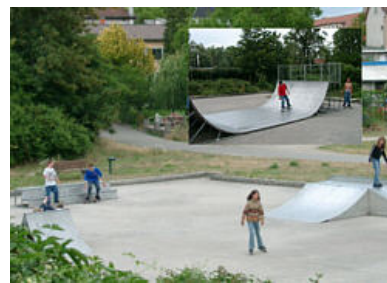
Skateboardanlage im Bruch- / Festplatzgelände

Auf dem Festplatz findet jährlich eines der größten Volksfeste im nordbadischen Raum, das Ketscher Backfischfest, mit weit über 150.000 Besuchern an 10 Veranstaltungstagen statt.