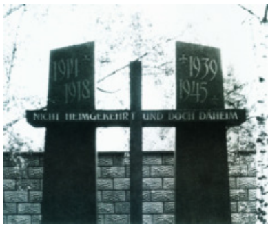
Friedhof-Ehrenmal für die Opfer der beiden Weltkriege

Opfer unter den Kriegsteilnehmern gefordert, war aber im Vergleich zu den darauffolgenden Kriegen relativ glimpflich an der Bevölkerung vorbei gegangen. Die beiden Weltkriege