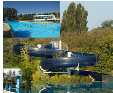
Ketscher Frei- und Wellenbad

Zum Sport – und Kulturzentrum im Ketscher Bruch kamen 1967 ein Hallenbad und 1973 ein Freibad mit Wellenbad hinzu. In diesem Zusammenhang darf auch auf den 12 ha großen Anglersee, mehrere Tennisplätze, sowie einen großen Festplatz mit Skateboardanlage verwiesen werden.