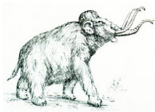
„Homo sapiens fossil“

Die oberrheinische Tiefebene mit ihrer klimatisch begünstigten Landschaft, in der auch die Gemarkung der Gemeinde Ketsch eingebettet ist, gehört zu den ältesten Lebens- und Siedlungsräumen der Menschen in Europa. Auch unter Berücksichtigung der Topographie ist davon auszugehen, dass das Gebiet in Urzeiten bevölkert war. Paläontologische und vorzeitige Funde, die in den Ketscher Kiesgruben (Anglersee, Hohwiesensee, Rheininsel-Baggerseen und auf der Hardt) gefunden wurden und im Geologisch-Paläontologischen Institut in Heidelberg aufbewahrt werden, beweisen u.a. das Vorhandensein von Mammut, Wisent, Wildpferd, Säbelzahn tiger und Breitstirn-Elch. Darüber hinaus konnte an Hand gefundener Schädelfragmente der Nachweis über die Existenz des