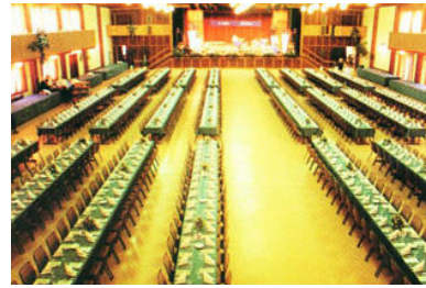
Rheinhalle- Fest- und Konzertbestuhlung