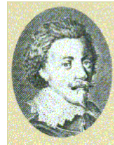
Graf Ernst von Mansfeld

Während des 30-jährigen Krieges (1618-1648) mit seinen Truppendurchzügen und Einquartierungen stand Ketsch zeitweilig am Rande des Ruins. Die Zerstörungen des Krieges machten Deutschland bettelarm. Auf dem flachen Land, insbesondere natürlich auch im Umland des Hochstifts Speyer, das genau an der Grenze zur protestantisch regierten Kurpfalz gelegen war, lagen unzählige Höfe und Dörfer in Schutt und Asche. Vor allem die für die protestantische Sache eintretenden zügellosen Truppen des Grafen Ernst von Mansfeld richteten unermesslichen Schaden an und zerstörten auch Ketsch zum größten Teil.